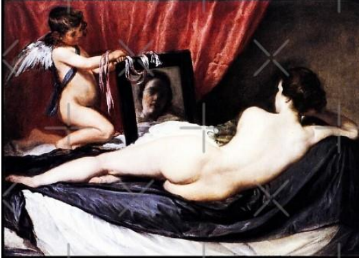
Aynalı Venüs, Diego Velasquez

Hollywood'un Adonis'i Arnold Schwarzenegger olsun, geçmiş imgeye yeniden hayat veren nostaljik bakış, geçmişin estetik kaygısını, kötü bir mimesis (taklit) tarzıyla işler ve tüketim piyasasına sunar.